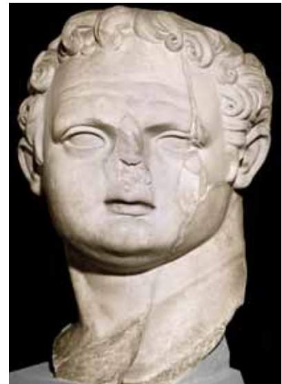
Kolossalkopf des Kaisers Titus, 79–81 n. Chr.

Von dem Tempel selbst haben sich jedoch nur der Stufenunterbau und die Fundamente für die Säulenstellung erhalten, da er in der Spätantike systematisch zerstört worden war. Die Weigerung der frühen Christen, dem Kaiser kultische Verehrung zu erweisen, war mit ein Grund für ihre Verfolgung und Ermordung. Es verwundert daher nicht, dass nach