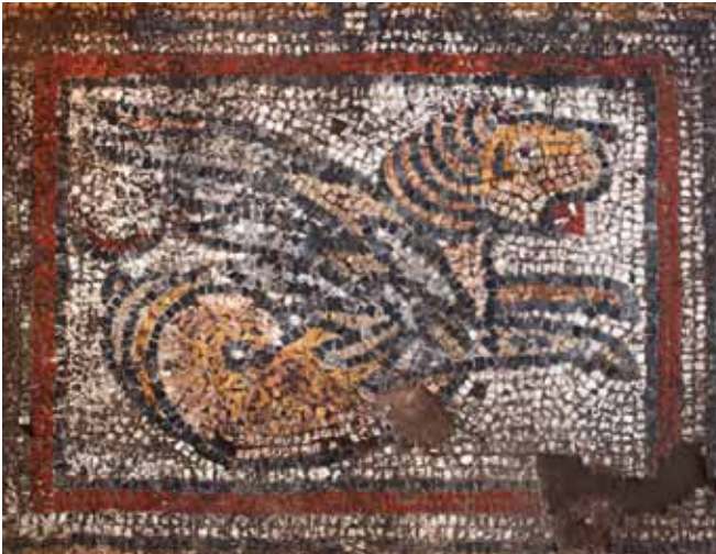
Mosaikfelder im Detail

» Sowohl in der Architekturdekoration als auch der beweglichen Ausstattung ist der christliche Charakter des Gebäudes nicht zu übersehen: Kapitelle und Platten wurden mit Kreuzen verziert, ebenso finden sich Türklopfer in Kreuzform. Zahlreiche Importamphoren, aber auch eine frühbyzantinische Kleinwaage zeugen von merkantilen Tätigkeiten. Da eine funktionale Bestimmung als Kirche ausgeschlossen ist, könnte es sich entweder um eine repräsentative Stadtresidenz oder aber um ein Verwaltungsgebäude im Zentrum der antiken Stadt Ephesos handeln.