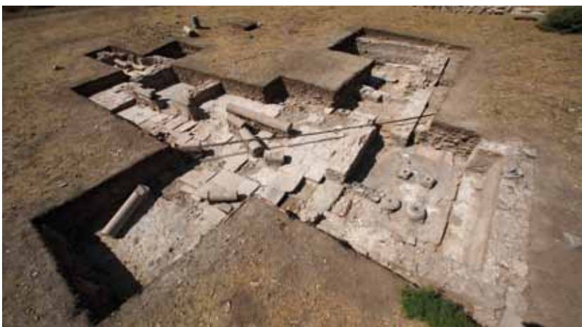
Spätantikes Gebäude im Überblick