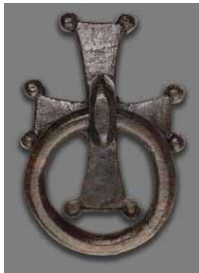
Türklopfer in Kreuzform

» Sowohl in der Architekturdekoration als auch der beweglichen Ausstattung ist der christliche Charakter des Gebäudes nicht zu übersehen: Kapitelle und Platten wurden mit Kreuzen verziert, ebenso finden sich Türklopfer in Kreuzform. Zahlreiche Importamphoren, aber auch eine frühbyzantinische Kleinwaage zeugen von merkantilen Tätigkeiten. Da eine funktionale Bestimmung als Kirche ausgeschlossen ist, könnte es sich entweder um eine repräsentative Stadtresidenz oder aber um ein Verwaltungsgebäude im Zentrum der antiken Stadt Ephesos handeln.