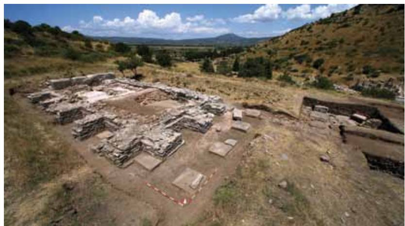
Reste des Kaiserkulttempels

Etablierung des Christentums als Staatsreligion gerade die Kaiserkulttempel besonders gründlich vernichtet und die Erinnerungen an sie ausgelöscht wurden.