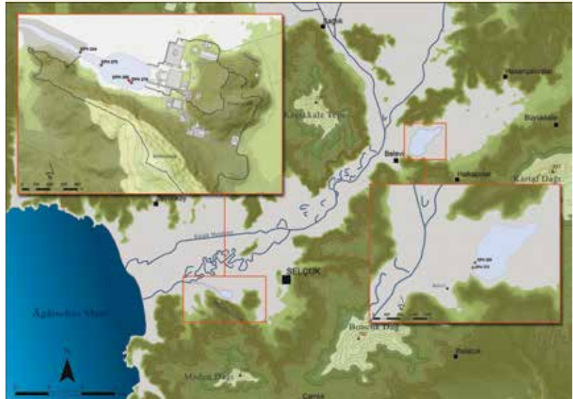
Die beiden Untersuchungsgebiete des Projekts »Pollen aus Ephesos« im römischen Hafenbecken und in den Sümpfen von Belevi (Karten: ÖAW-ÖAI/C. Kurtze)

Böden stellen als sogenannte Geoarchive eine unschätzbare wertvolle Quelle für die Umweltarchäologie dar: Ablagerungen verschiedenster Herkunft bleiben darin – geeignete Bedingungen vorausgesetzt – über viele Jahrtausende hinweg erhalten. Können die Geschichten, die in diesen Archiven schlummern, lesbar gemacht werden, tragen sie wesentlich zum Verständnis der Natur bei, in welcher sich der Mensch in früheren Epochen zurechtfinden musste. In einer Natur, die er durch sein Leben und Wirtschaften aber auch stets veränderte und gestaltete.