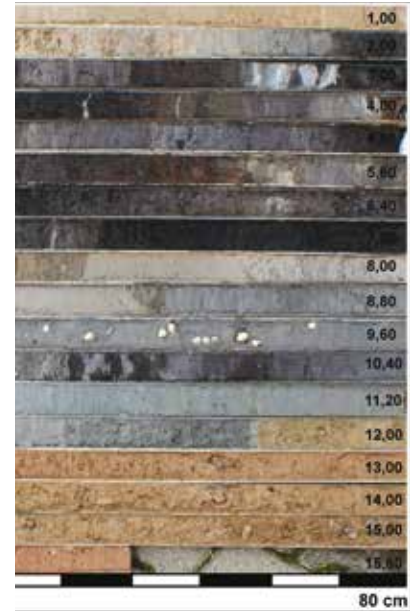
Der über 15 m lange Kern EPH 375 in seinen Einzelsegmenten. Die Bohrtiefe nimmt von links nach rechts und von oben nach unten zu

der in den Bodenschichten eingefangenen Pollenkörner geben die daraus erstellten Pollenprofile Auskunft über die Zusammensetzung einstiger Vegetation und ihre Veränderung im Lauf der Jahrhunderte. So zeigte sich, dass im Raum um Ephesos nach ersten bemerkbaren Einflüssen des Menschen auf die Vegetation im 7. Jahrtausend v. Chr. erst mit Beginn des 1. Jahrtausends v. Chr. jene große Landnahme stattfand, die schließlich zur Formung der heutigen Mittelmeervegetation führte: eine massive Reduktion der Waldflächen zugunsten von Ackerland sowie der verstärkte Anbau von Getreide, Wein und Oliven. Für denselben Zeitraum weisen geographische Parameter wie die