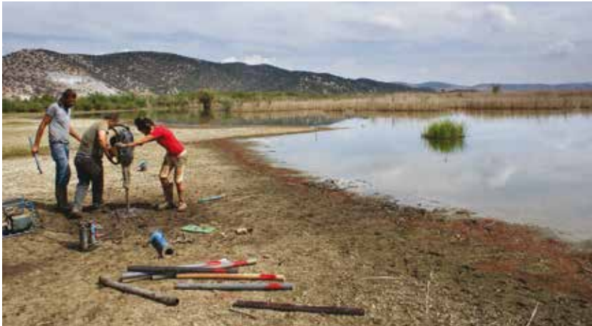
Entnahme des Bohrkerns EPH 375 am Ufer der Sümpfe von Belevi im September 2013

Titelbild: Mikroskopisch kleine Gehäuse von Foraminiferen. Diese wasserlebenden Organismen reagieren sehr empfindlich auf Umweltveränderungen. Die abgebildeten Arten zeigen den Salzgehalt im Wasser an (links: hoher Salzgehalt, rechts: geringerer Salzgehalt) und helfen damit, den wechselnden Einfluss von Meer und Küçük Menderes auf das Hafengebiet zu entschlüsseln